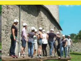
10 | Überwinden