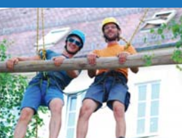
15 | Beschützen