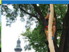
13 | Unterstützen