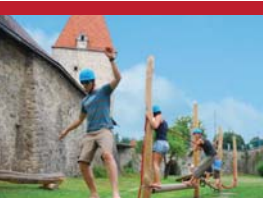
8 | Seilschaft bilden