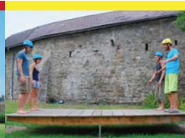
9 | Stabilisieren