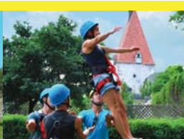
12 | Höhenflug erleben