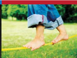
14 | An einem Strang ziehen